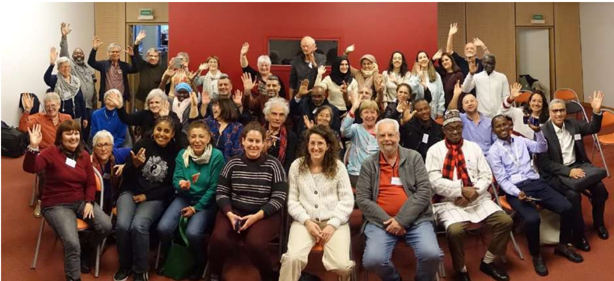
Bénévoles et partenaires au cours du séminaire des 45 ans du COBIAC (mars 2024)